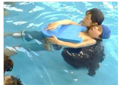
体を支えてもらいながら、足を浮かせることができたよ！！

冬季は、活動の最後にみんなでお風呂に入り、体を温めます。そこで3年生は、頭や体を洗う練習も行っています。