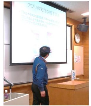
基本的な操作の説明

参加者からは「もっと情報を集めて子どもに合ったアプリを見つけたい。」、「スイッチ類を使った授業などにも取り組みたい。」などの感想があり、今後の授業での活用方法について考えていく機会となりました。