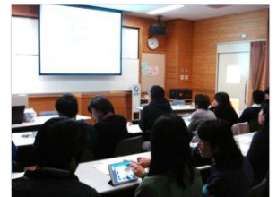
「Keynote」を使ってのスライド作成実習