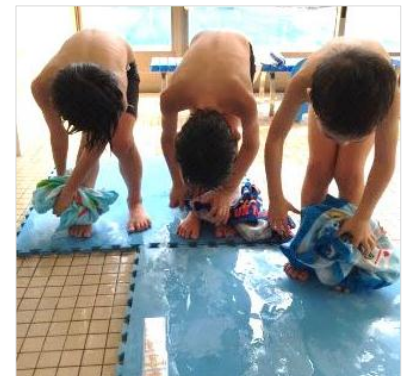
手順書を見ながら、体洗いや体拭きなどができるよ！